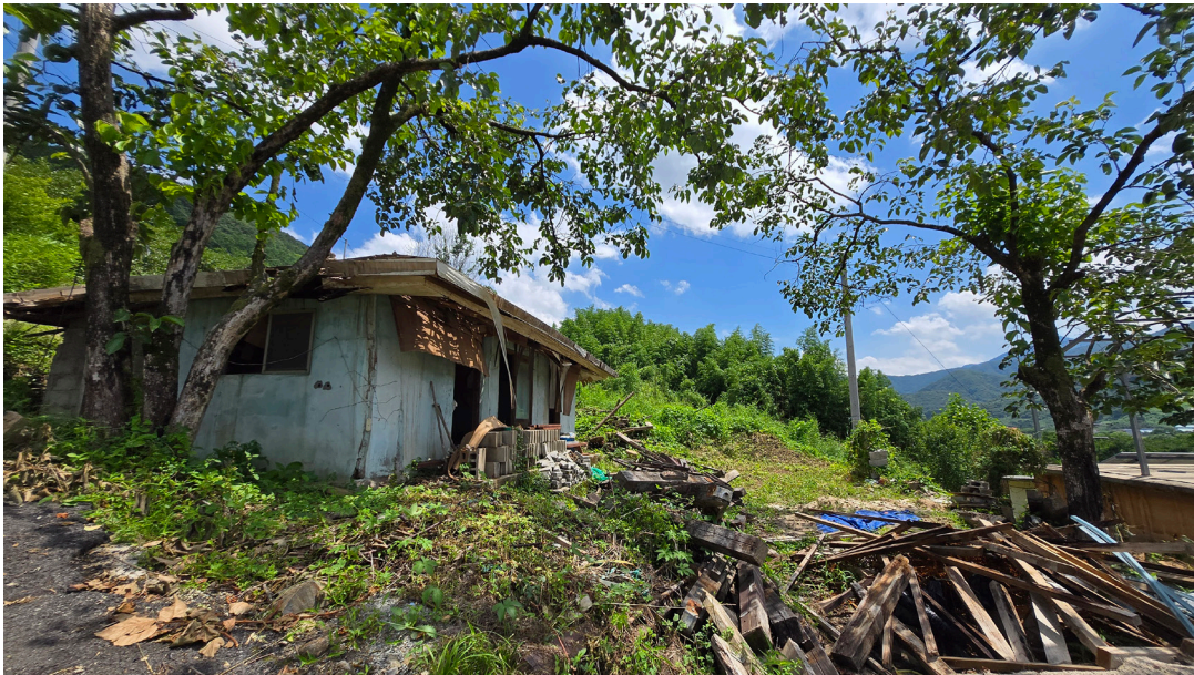
[하동 해방촌 2025. 07]

흔적은 미미했지만, 청주의 작은 해방촌 자취를 기록하려는 청주 기록가들의 시도는 한국 근현대사에 대한 물음과 기록가로서의 소명 의식에서 비롯된 것이라 생각합니다.