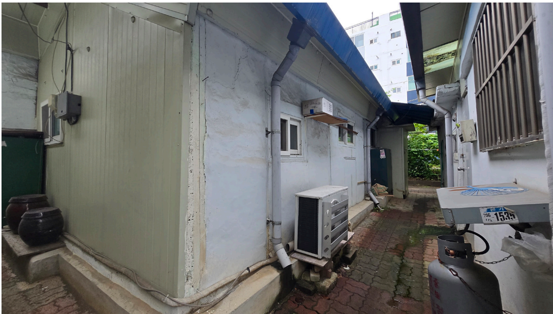
[청주 운천동 피난민 수용소 2025. 06]

이 일을 계기로, 저는 일로든 여가로든 어느 지역을 가든 ‘해방촌’이라는 마을 이정표가 보이면 한번 가보고 싶다는 생각이 들었습니다. ‘인구감소지역’의 기록 일을 하며 요즘 많은 시간을 보내는 경상남도 하동에서도 ‘해방촌’이라는 간판이 보여 섬진강에 바로 접한 마을을 일부러 찾아가 본 적이 있습니다. 그곳은 아주 가파른 산 능선에 집들이 점적으로 분포되어 있었고, 폐허가 된 지 적어도 30년은 족히 되었을 법한, 변변찮은 목구조에 흑으로 엮기설기 미장을 한 폐가들이 눈에 들어왔습니다. 그 모습을 보며 이 또한 좀