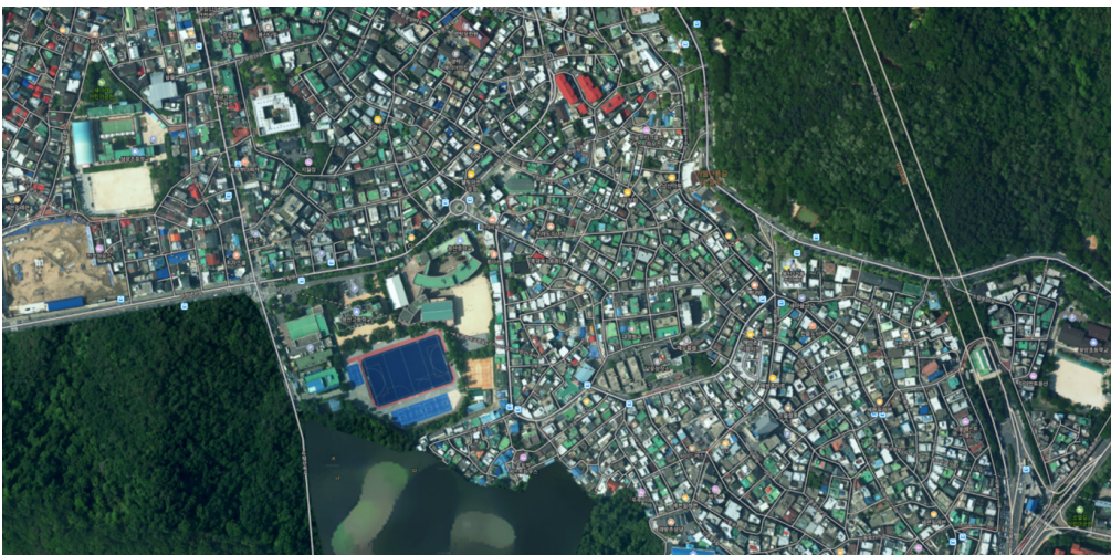
[서울 용산 해방촌 선천군민회 부지 위치]

이와 달리 청주 해방촌은 변화한 도시 조직 속에 점처럼 주거의 한 조각이 남겨져 있는 정도였습니다. 세월을 더하며 생존을 위한 보호막들이 계속해서 더해진 주거동만이 남아 있었습니다. 운천동에는 4살에 포대기에 업혀 이곳으로 와 혼자 사시는 분이 유일한 선주민이라고 합니다. 영운동은 7가구 정도가 산다고 하지만 모두 비어있는 채 남겨져 있다는 점에서, 기록가가 들을 수 있는 구술 증언 또한 매우 제한적인 상황이었습니다. 왜 이곳에 해방촌이, 어떤 과정으로 어